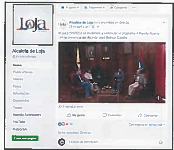
Imagen 2.- En programa A Puerta Abierta periodistas conocen del avance de la PTAR 28-04-2018