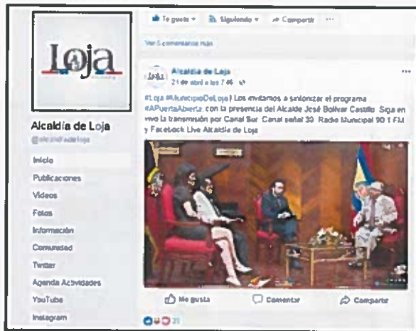
Imagen 1.- En programa A Puerta Abierta se conoce de avance de la Construcción de la PTAR 21-04-2018

Los periodistas de los medios invitados conocen del avance del proyecto de Regeneración Urbana, uno de sus componentes la Construcción de la Planta de Tratamiento de Aguas Residuales para la Ciudad de Loja. Primera Etapa.