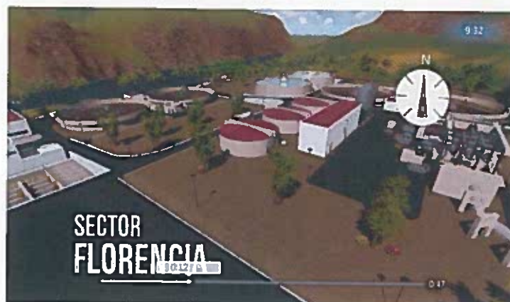
Imagen 6.- Spot que se difunde en medios de comunicación Relacionado a la construcción de la Planta de Tratamiento de Aguas Residuales

Dentro del Plan de Comunicación está contemplada la difusión de este componente en diferentes medios de comunicación, para ello La Unidad de Regeneración Urbana mantiene contratos de publicidad que están debidamente registrados en el Portal Institucional del Servicio Nacional de Contratación Pública www.compraspublicas.gob.ec