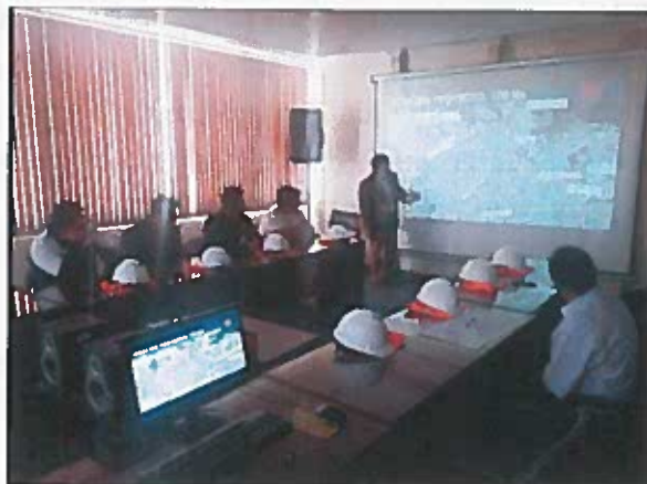
Imagen 3 - Concejales de Pedro Carbo - Pichincha conocen del proyecto de Construcción de la Planta de Tratamiento de Aguas Residuales 19-04-2018

A través de casas abiertas, ferias ciudadanas se da a conocer el avance del proyecto con la entrega de material publicitario, exhibición de paneles ilustrativos que contienen información del proyecto de Regeneración Urbana en sus diferentes componentes, siendo uno de ellos el de la Construcción de la Planta de Tratamiento de Aguas Residuales para la ciudad de Loja. Primera Etapa