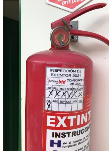
Foto 08: Se dispone de extintores contra incendios con carga vigente, estos se encuentra dispuestos en lugares estratégicos de la obra