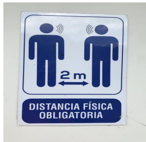
Foto 09 -10 Todas las áreas cuentan con señalización de seguridad