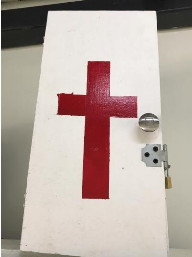
Foto 07: Se cuenta con botiquines de primeros auxilios completamente equipados