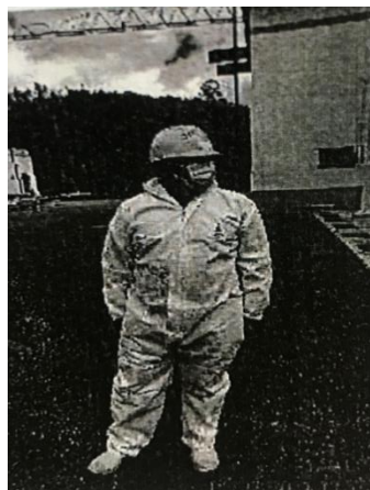
Foto 05: Todo el personal que forma parte del proyecto cuenta con el Epp, vestimenta y calzado acorde a la actividad a realizarse