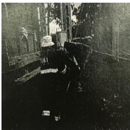
Foto 06: Entrega de residuos comunes al personal de Higiene Municipal