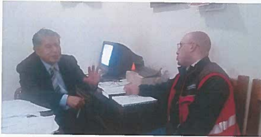
Técnico socializa la colocación de tubería en el colector marginal, que conduce a la PTAR

Es responsabilidad social de la institución, mantener informada a la ciudadanía y explicarle las medidas de contingencia en cuanto a movilidad que se emprenden en cada frente de trabajo.