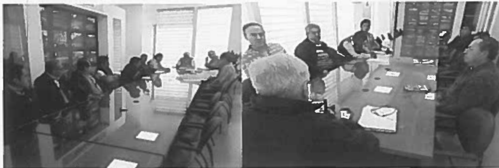
Reuniones de trabajo con involucrados en el proyecto

A pesar de que el proyecto está concluido, las partes involucradas (Municipio, contratista, CNT, EERSSA y fiscalización) mantienen reuniones para definir algunos aspectos pendientes previo a la recepción provisional de la obra, así como para reparar las observaciones planteadas por las comisiones especiales.