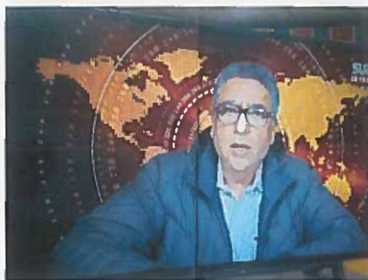
Entrevista en Canal Sur