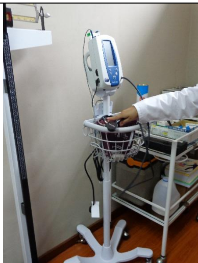
SPOT DE SIGNOS VITALES