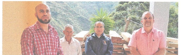
» Se hizo la entrega-recepción con la presencia de los beneficiarios y donantes.

6,42 metros cúbicos de madera fueron donados a la parroquia ‘San Juan Bautista-El Valle’ del cantón Loja, por parte de la Dirección Zonal 7 del Ministerio del Ambiente, Agua y Transición Ecológica.