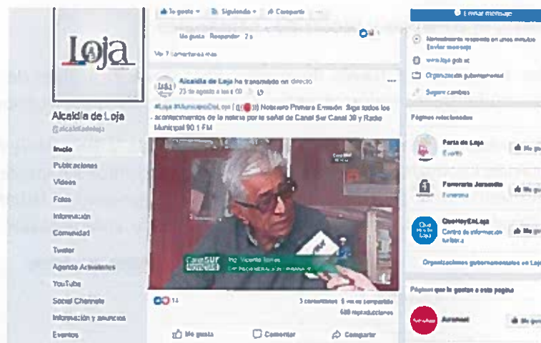
Imagen 1.- Entrevistas en Canal Sur con Director (E) de la Unidad de Regeneración Urbana (23-08-2018)