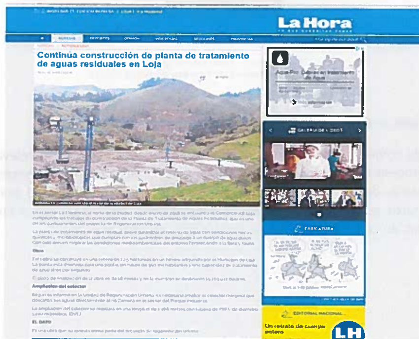
Imagen 2.- Medios de Comunicación Social impresos de la localidad Difunden avance de los trabajos (21-08-2018)